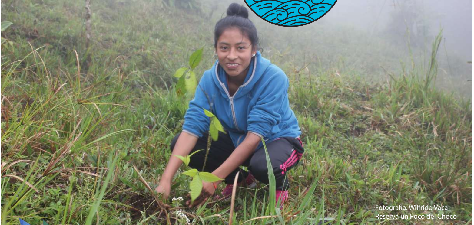
Reserva un Poco del Chocó