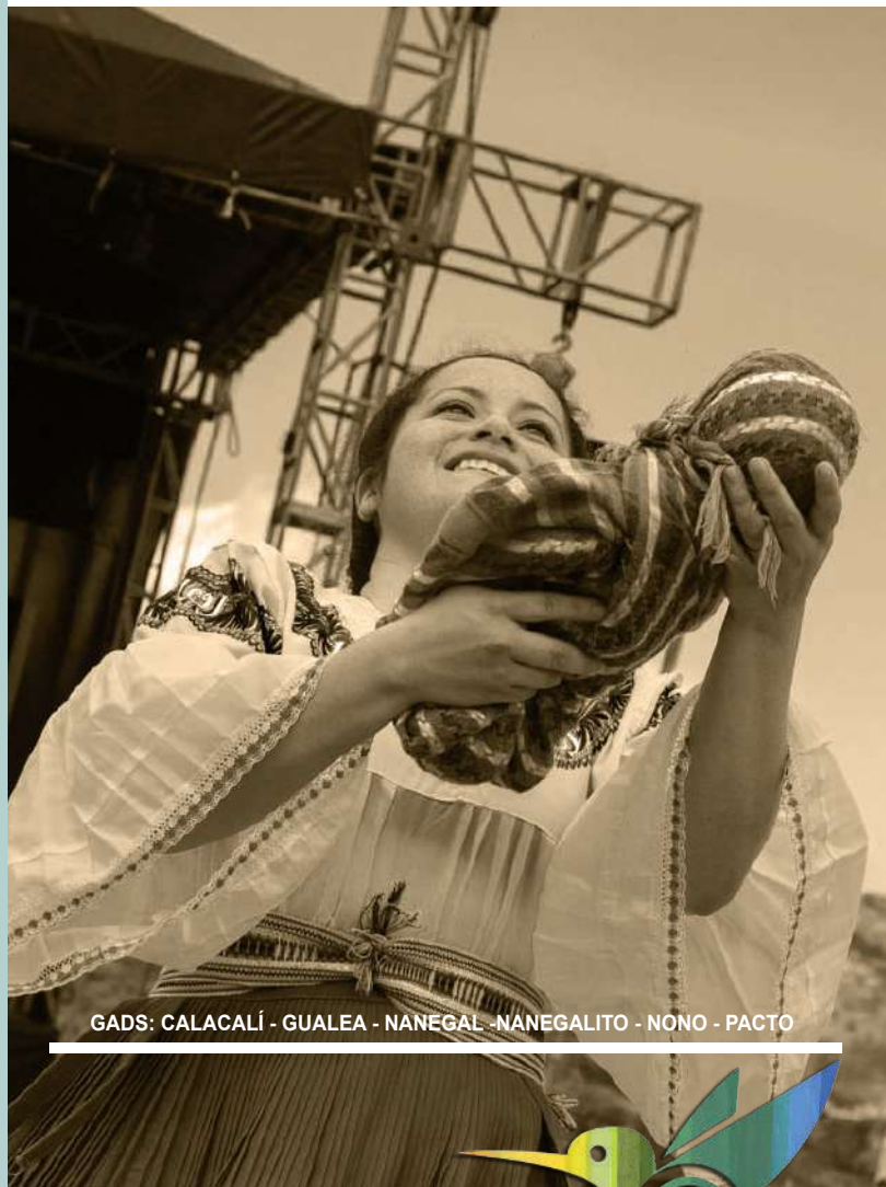
GADS: CALACALÍ - GUALEA - NANEGAL - NANEGALITO - NONO - PACTO

Mancomunidad de la Bio-región del Chocó Andino